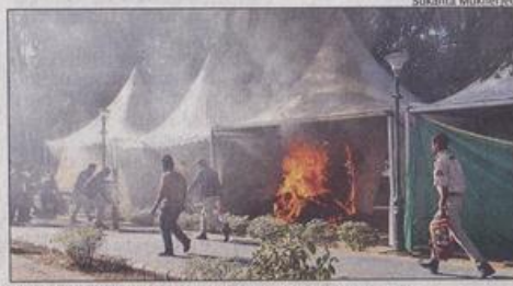
Kitchen of expo at Parade Ground suddenly caught fire

Around 300 delegates participated in the WAC International Delegates Assembly held on Friday. Highlighting the growing demand for Ayurveda in their countries, representatives from Australia, South Korea, Singapore, Portugal, Poland, Argentina