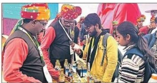
देहरादून के परेड ग्राउंड में शुक्रवार को 10वीं विश्व आयुर्वेद कांग्रेस एवं आरोग्य एक्सपो-2024 में लगे स्टॉलों से खरीदारी करते लोग।