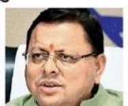
मुख्यमंत्री पुष्कर सिंह धामी • जगद्वारा

केंद्रीय आयुष मंत्रालय से प्राप्त जानकारी के अनुसार वर्ष 2023 में उत्तराखंड में 42 लाख 64 हजार व्यक्तियों ने आयुष सेवा का लाभ उठाया है। इस वर्ष अक्टूबर तक 24 लाख 56 हजार लोग इस सेवा से लाभान्वित हो चुके हैं। विश्व आयुर्वेद कांग्रेस एवं आरोग्य एक्सपो के दौरान उत्तराखंड की प्रगति को खास चर्चा हुई है। आयुर्वेद कांग्रेस में शामिल होने के लिए देहरादून आए सचिव आयुष, वीडियो रजिस्ट्रार कोटेवा ने उत्तराखंड की प्रगति की सराहना की है। उनका कहना है कि राष्ट्रीय स्वास्थ्य मिशन के तहत केंद्रीय आयुष मंत्रालय की कोशिश प्राथमिक स्वास्थ्य सेवाओं को घर-घर तक पहुंचाने की है। उत्तराखंड में राष्ट्रीय आयुष मिशन को सफलता उन्माहित करने वाली है। राष्ट्रीय स्वास्थ्य मिशन के तहत आयुष के 300 आयुषमन आरोग्य मंदिर संचालित हो रहे हैं। इनमें से 150 आरोग्य मंदिरों का