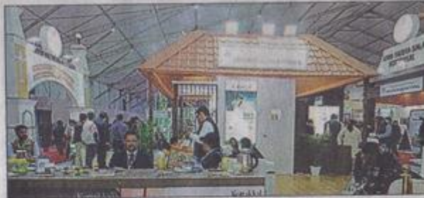
The 10th World Ayurveda Congress (WAC) is taking place in Dehradun from December 12-15.

"The initiative would also play a major role in effectively dealing with the problems of hunger, malnutrition and obesity, besides helping the government meet the development goals set by the World Health