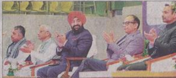
परेड ग्राउंड में आयोजित 10वीं विश्व आयुर्वेद कांग्रेस एवं आरोग्य एक्सपो-2024 के समापन समारोह में मंच पर मौजूद राज्यपाल व अन्य।

राज्यपाल ने परेड ग्राउंड में आयोजित चार दिवसीय दसवीं विश्व आयुर्वेद कांग्रेस एवं आरोग्य एक्सपो-2024 के समापन समारोह में रविवार को शिरकत की। राज्यपाल ने कहा कि आयुर्वेद को डिजिटल, आर्टिफिशियल इंटेलिजेंस जैसी आधुनिक प्रणालियों के साथ जोड़ने पर केंद्रित यह आयोजन आयुर्वेद को न केवल अधिक सुलभ बनाएगा बल्कि इसे वैश्विक स्तर पर प्रभावी रूप से प्रस्तुत भी करेगा। इन चार दिनों में हमने विचारों, ज्ञान और नवाचारों का अद्भुत संगम देखा। उत्तराखंड की प्राकृतिक सुंदरता और आध्यात्मिक