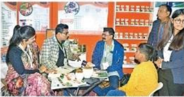
परेड ग्राउंड में विश्व आयुर्वेद कांग्रेस व आरोग्य एक्सपो में तेल एक कंपनी स्टाल में लोगों की खरीदारी के दृश्य।

जागरण संवाददाता, देहरादून : 10वीं विश्व आयुर्वेद कांग्रेस (डब्ल्यूएसी) और आरोग्य एक्सपो में स्टाल पर लोग खूब खरीदारी कर रहे हैं। विभिन्न राज्यों और फ्रीडोम कॉर्पोरेशंस के आकर्षक थ्री-डी डिस्प्ले वाले स्टाल लगाए गए हैं। इनमें तबचा, पेट व सर दर्द संबंधी कई रोग के निवारण के लिए दवा उपलब्ध है। जिनकी लोग खूब खरीदारी कर रहे हैं। आजकल ठंड के दिनों में जोड़ों के दर्द से संचित तेल और लोगन की सर्वाधिक मांग है।