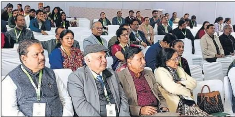
देहरादून के परेड ग्राउंड में शुक्रवार को 10वीं विश्व आयुर्वेद कांग्रेस एवं आरोग्य एक्सपो-2024 के दौरान उपस्थित प्रतिभागी।

आयुर्वेद आहार विषय पर व्याख्यान में पैनेलिस्ट ने बताया कि शरीर की प्रकृति (कफ, वात, पित) के अनुरूप आहार हो। यह भी सुझाव आया कि भारतीय खाद्य सुरक्षा एवं मानक प्राधिकरण को खाद्य पदार्थों के सर्टिफिकेशन में आयुर्वेद आहार के मानक को भी शामिल करना चाहिए। 'एविडेंस बेस्ड आयुर्वेद' थीम पर आधारित व्याख्यान में विशेषज्ञों ने कहा कि आयुर्वेद के क्षेत्र में नित्य होने वाले नए शोध एवं व्यावहारिक ज्ञान को सही करने के लिए एक मानक संस्था