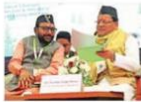
CM Pushkar Singh Dhami with Union MoS Prataprao Jadhav in Dehradun.

Addressing the 10th Ayurveda Congress and Arogya Expo 2024 on Thursday, he said that delegates from 50 countries and over 3,000 experts are participating in the event. The CM urged the AYUSH Ministry to es-