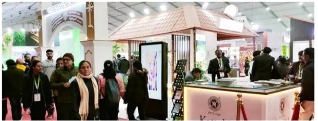
ഡെറാഡൂണിൽ ലോക ആയുർവേദ കോൺഗ്രസ് എക്സ്പോയിലെ കോട്ടക്കൽ ആര്യവൈദ്യശാലയുടെ പാവലിയൻ.

ഡെറാഡൂൺ (ഉത്തരാഖണ്ഡ്): ലോക ആയുർവേദ കോൺഗ്രസ് പത്താം പതിപ്പിന്റെ ഭാഗമായി നടക്കുന്ന ആരോഗ്യ എക്സ്പോയിൽ പാരമ്പര്യവും ആധുനികതയും സമന്വയിക്കുന്നു. പരമ്പരാഗത അറിവുകൾക്കൊപ്പം അത്യാധുനിക സാങ്കേതികവിദ്യകൾ പ്രയോജനപ്പെടുത്തി വികസിപ്പിച്ചെടുത്ത ആയുർവേദ മരുന്നുകളും ചികിത്സാതിരികളും ഇവിടെ പ്രദർശിപ്പിച്ചിരിക്കുന്നു. ഭാരതത്തിനകത്തും പുറത്തുമുള്ള പ്രമുഖ ആയുർവേദ സ്ഥാപനങ്ങളാണ് എക്സ്പോയിൽ പങ്കാളികളായിരിക്കുന്നത്. പത്താമത് ലോക ആയുർവേദ കോൺഗ്രസ് ഇന്ന് സമാപിക്കും. ഡിജിറ്റൽ സാങ്കേതികവിദ്യ ഉപയോഗപ്പെടുത്തി ആയുഷ് മന്ത്രാലയം ഒരുക്കിയ വലിയ സ്റ്റാൾ ഈ രംഗത്തെ ഏറ്റവും പുതിയ മുന്നേറ്റം വരെ അടയാളപ്പെടുത്തുന്നു. കോട്ടക്കൽ ആര്യവൈദ്യശാല, വൈദ്യരത്നം ഔഷധശാല, കോയമ്പത്തൂർ ആര്യവൈദ്യ ഫാർമസി, ശ്രീധരിയം, ഔഷധി, ഹിമാലയ, നാഗാർജുന, ഡാംബർ തുടങ്ങിയ സ്ഥാപനങ്ങളും വിപുലമായ സ്റ്റാളുകളാണ് ഒരുക്കിയിരിക്കുന്നത്. മരുന്നുകൾക്ക്