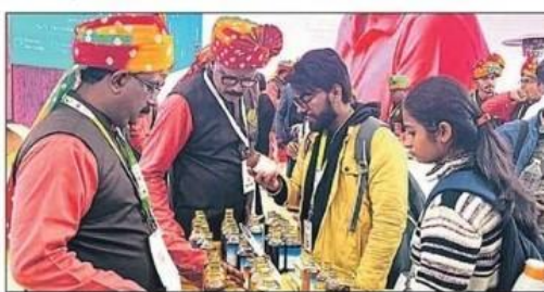
देहरादून के परेड ग्राउंड में शुक्रवार को 10वीं विश्व आयुर्वेद कांग्रेस एवं आरोग्य एक्सपो-2024 में लगे स्टॉलों से खरीदारी करते लोग।