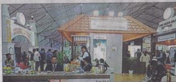
The 10th World Ayurveda Congress (WAC) is taking place in Dehradun from December 12-15.

"The initiative would also play a major role in effectively dealing with the problems of hunger, malnutrition and obesity, besides helping the government meet the development goals set by the World Health