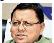
मुख्यमंत्री पुष्कर सिंह धामी • जागरण

केंद्रीय आयुष मंत्रालय से प्राप्त जानकारी के अनुसार वर्ष 2023 में उत्तराखंड में 42 लाख 64 हजार व्यक्तियों ने आयुष सेवा का लाभ उठाया है। इस वर्ष अक्टूबर तक 24 लाख 56 हजार लोग इस सेवा से लाभान्वित हो चुके हैं। विश्व आयुर्वेद कांग्रेस एवं आरोग्य एक्सपो के दौरान उत्तराखंड की प्रगति को खास चर्चा हुई है। आयुर्वेद कांग्रेस में शामिल होने के लिए देहरादून आए सचिव आयुष वेंकट रजेश कोटेपा ने उत्तराखंड की प्रगति की सराहना की है। उनका कहना है कि राष्ट्रीय स्वास्थ्य मिशन के तहत केंद्रीय आयुष मंत्रालय की कोशिश प्राथमिक स्वास्थ्य सेवाओं को घर-घर तक पहुंचाने की है। उत्तराखंड में राष्ट्रीय आयुष मिशन को सफलता उन्माहित करने वाली है। राष्ट्रीय स्वास्थ्य मिशन के तहत आयुष के 300 आयुमान आरोग्य मंदिर संचालित हो रहे हैं। इनमें से 150 आरोग्य मंदिरों का