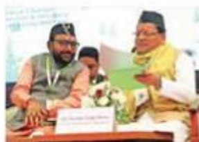
CM Pushkar Singh Dhami with Union MoS Prataprao Jadhav in Dehradun.

Addressing the 10th Ayurveda Congress and Arogya Expo 2024 on Thursday, he said that delegates from 50 countries and over 3,000 experts are participating in the event. The CM urged the AYUSH Ministry to es-